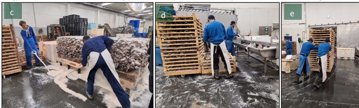
Figur 5: Ved tradisjonell omlegging (bilde 5c) slås alt det overfløydige saltet ned på golvet, og det brukes tid og ressurser til å samle og fjerne det. På en effektiv dag kan dette dreie seg om volumer opp mot 10 tonn. Når trommelen samler saltet rett i kar, blir det mye mindre salt på golvet, og dermed en lettere og tryggere arbeidsplass (bilde 6de).

Saltmengden på golvet er kraftig redusert, og dette er illustrert i figur 5. Bedriften vil fortsette å utvikle løsninger som samler opp mer av saltet, slik at det blir enda mindre salt liggende i produksjonen. Dette vil de gjøre ved å tette flaskehalsen og plassere kar på flere steder i prosessen, om nødvendig.