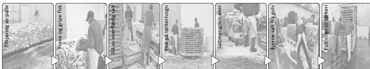
Figur 1: Omlegging av klippfisk består av mange tunge manuelle operasjoner som utfordrer arbeidsmiljø og HMS.

Produksjon av klippfisk er arbeidskrevende og inneholder mange produksjonstrinn. I starten legges flekket fisk og salt lagvis i kar, samtidig som karet fylles med saltlake. Etter modning, vendes innholdet i karet over på en palle. Omlegging (figur 1) fra palle til tørkerivogner involverer flere tunge manuelle arbeidsoperasjoner, som utfordrer både arbeidsmiljø (tunge løft, dårlig arbeidsstilling) og HMS (glatte golv på grunn av salt). Omlegging inkluderer at en palle flyttes fra oppbevaringsstedet til arbeidsstasjonen. På arbeidsstasjonen må ansatte børste av salt, gripe fisken og riste av overflødig salt før fisken legges på tørkerivognene. Denne arbeidsprosessen tar mer tid, jo mindre fisken er. Underveis øker mengden salt rundt arbeidsstasjonen. Saltet må jevnlig fjernes fra golvet.