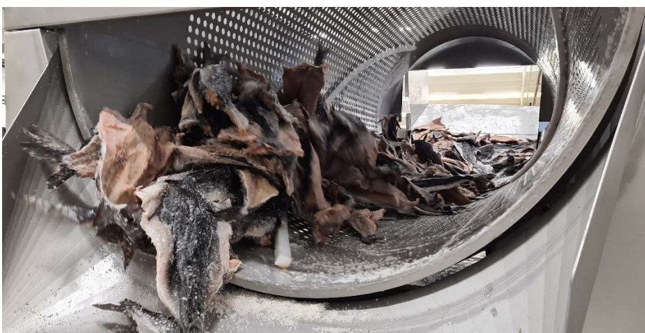
Figur 3: Fisken splittes godt gjennom trommelen. Samtidig er perforeringen stor nok til at saltet effektivt fjernes og samles under trommel. Fisken opprettholder kvaliteten gjennom trommelen.

I innkjøringsfasen er det brukt mye tid på hastighet, helning og framdrift i selve trommelen. Fisken spres godt gjennom trommelen (figur 3). Hastigheten til trommelen har trinnløs justering, og det er brukt tid til å finne en hastighet som fjerner nok salt (men ikke alt) og som ikke skader fisken. Perforeringen i trommelen er stor nok til at saltet effektivt fjernes, uten at fisken hekter eller blir skadet. Innmatingen er nå manuell, og ofte kommer en hel palle av gangen. Trommelen er nå så effektiv at det bør utvikles en mer effektiv og tilpasset innmating.