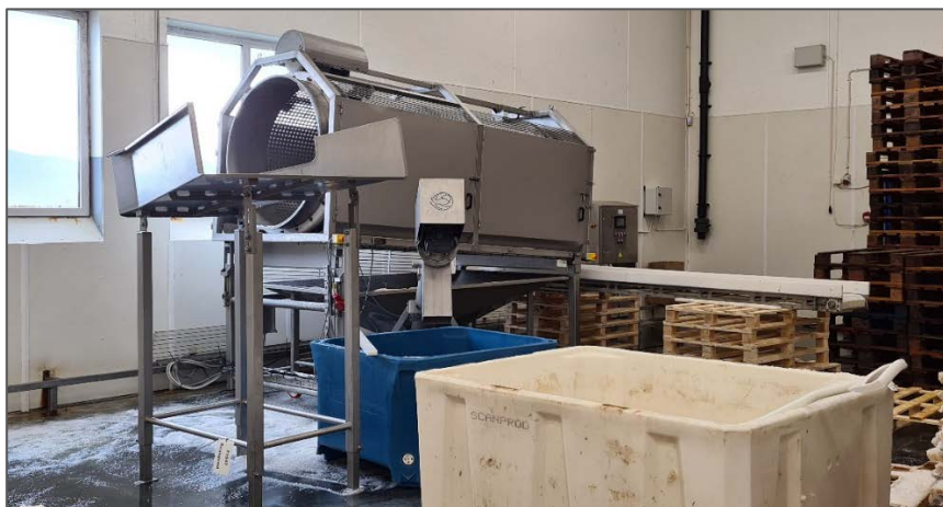
Figur 2: Trommel for effektiv omlegging av liten klippfisk ble produsert av Optimar AS og installert hos ScanProd i august 2021.

Optimar har produsert og ScanProd har installert, tilpasset og tatt i bruk en trommel (figur 2) for å effektivisere omleggingen. Trommelen ble installert i august 2021. I perioden fra august til november har ScanProd gjort tilpassinger, for å få riktig framdrift for klippfisken og god oppsamling av salt.