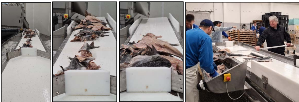
Figur 6: Det er utviklet en transportløsning ut fra trommelen.

Trommelen har nå så høy virkningsgrad at den er tatt i bruk i daglig drift. Trommelen har god funksjon for liten sei. I tillegg virker det som at den også kan brukes på andre fiskearter, når fisken er liten, uten å redusere produktkvaliteten. Trommelen har bidratt til en dobling av antall paller som legges om, pr. dag. I tradisjonell omlegging beregnes det 10-12 minutter for å legge om en palle, mens med trommelen er denne redusert til 5-6 min. Det er to hovedfaktorer til denne kapasitetsøkningen. Med trommelen er det trommelhastighet og innmating som bestemmer tempo, ikke arbeiderene. I tillegg er saltet tilnærmet fjernet fra golvet, slik at arbeidsoppgaver som å koste, spa og kjøre vekk salt er kraftig redusert. For ScanProd betyr denne kapasitetsøkningen at de nå kan legge om opptil 80 paller om dagen, mot 40-50 tidligere. Verdien av denne effektiviseringen anslås til rundt 1 000 000,- for bedriften.